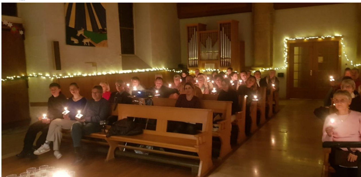
Légende : Veillée de Noël 2024 à l'église de Montagny-près-Yverdon.